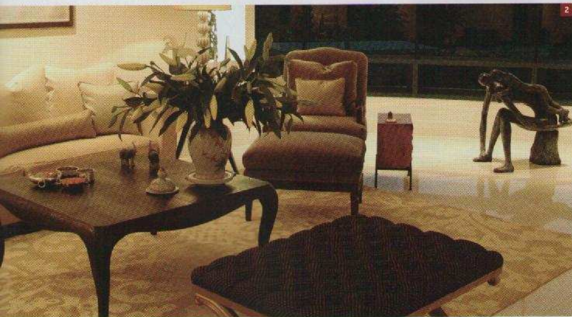
1: PISO 51 Club privado, México, DF, 2007.