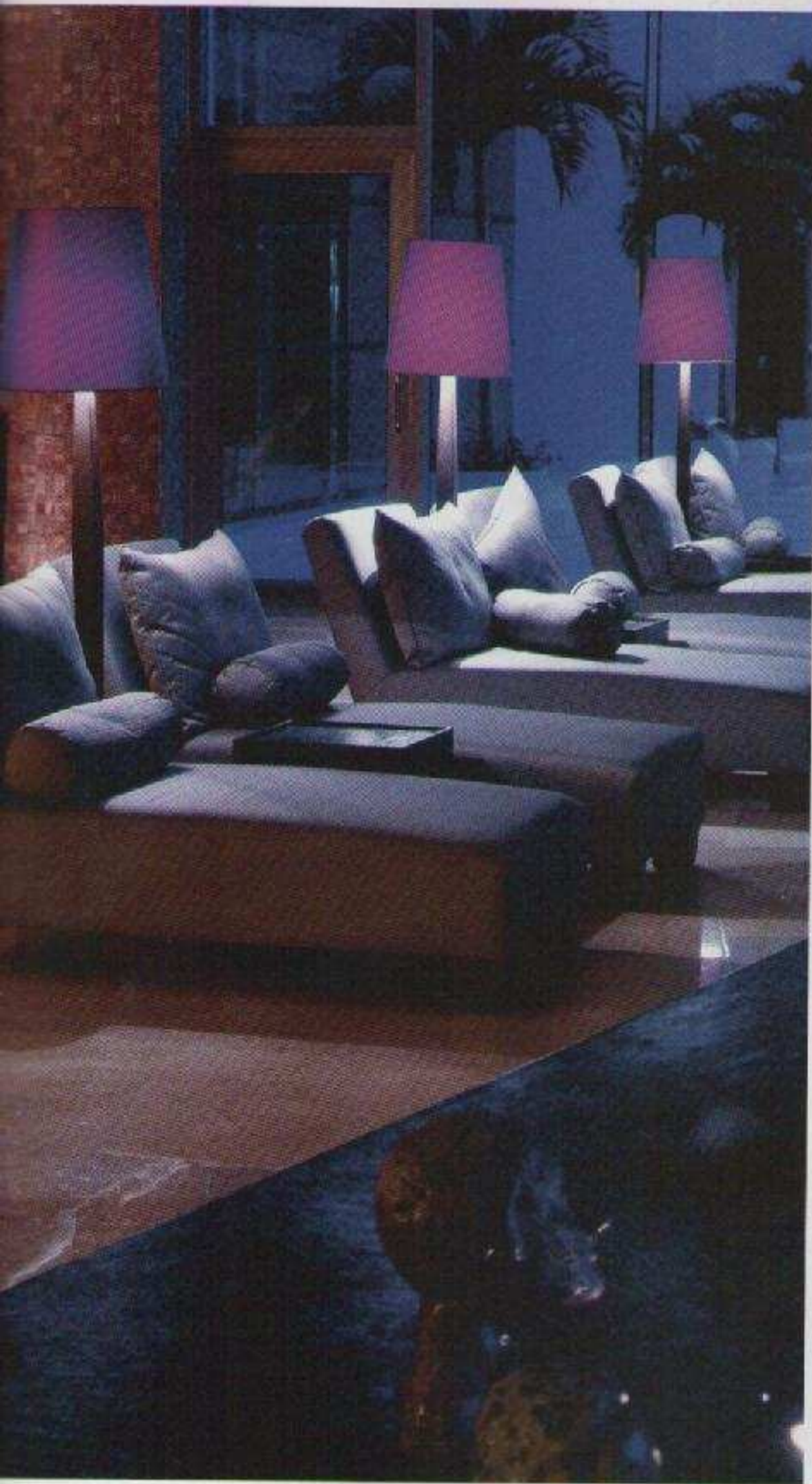
GRAND AQUA Hotel, Cancún, Quintana Roo, 2008.

S i bien, el diseño del piso 51 de la Torre Mayor es uno de sus más conocidos proyectos, Francisco Hanhausen ha realizado el diseño de interiores de espacios residenciales, así como proyectos para tiendas, discotecas, bares, hoteles (Grand Aqua, en Cancún) y restaurantes, como el Landó y el Ivoire en ciudad de México. Es profesor de diseño de interiores en la Universidad Iberoamericana. Su estilo, armonioso y cuidadoso de los detalles, ha hecho énfasis en una estética sobria y clásica plagada de destellos contemporáneos. Ganando con ello amplio reconocimiento en el desarrollo de espacios elegantes.